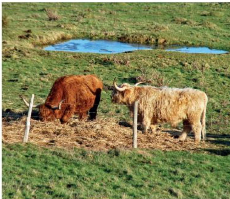
Bovins de la race highland

Un pâturage extensif permet de limiter l'embroussaillage du site. C'est un véritable cheptel que possède le gestionnaire du site, Eden 62. Les chèvres, plus légères que les chevaux et les bovins, sont utilisées sur les bords de la carrière comme tondeuses naturelles, écologiques et économiques. Eden 62 possède également des chevaux. Tous ces animaux sont utilisés dans le même but, en adoptant le cheptel en fonction de la gestion. Dans le marais, des vaches Highlands, qui prennent le relais des poneys, ont été introduites, ainsi que 150 moutons au Blanc-nez et au Gris-Nez.